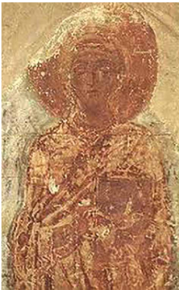
Fresc de Santa Tecla. Catedral de El Salvador

1. Un dels primers problemes amb què ens trobem a l'hora d'abordar la figura de Tecla, és la seva ubicació