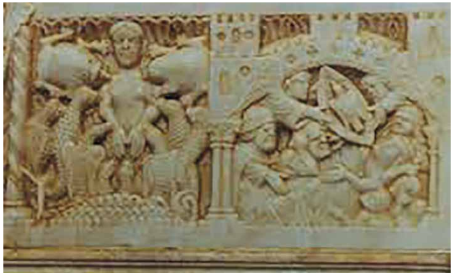
Santa Tecla entre les feres Catedral de Tarragona (s.XII)

11. Tant Tecla com els personatges femenins que intervenen en la narració posseeixen una categoria central i normativa . El principi normatiu és, doncs, la "plena humanitat de les