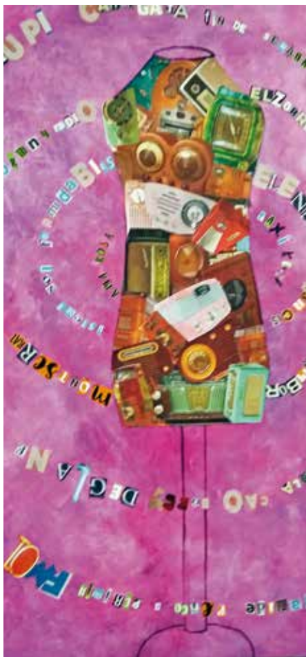
Artista: Mer Matalonga

les víctimes i mantenir-les en una situació d'inferioritat, de marginalitat, sinó per apoderar-les i per restituir-les públicament. Han de ser els perpetradors de violacions, els maltractadors, l'exèrcit o el govern abusador, els qui quedin assenyalats com a culpables.