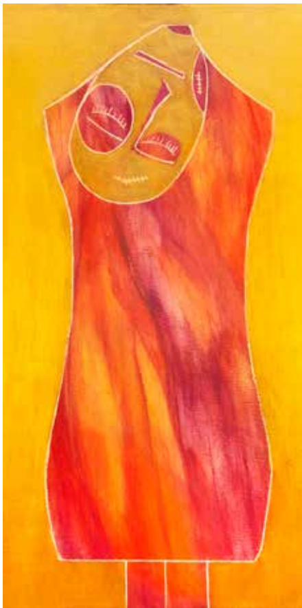
Artista: Mer Matalonga

la seva època i, malauradament, encara de la nostra: