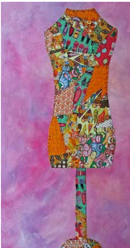
Artista: Mer Matalonga

La interpretació d'alguns textos bíblics de la tradició cristiana han contribuït a fer creure, tant a creients com a no creients, que hi ha hagut una creació jerarquitzada de l'ésser humà. Un sexe no marcat i un altre que ha sorgit com a acompanyant i complement. De l'expulsió del paradís del mite d'Adam i Eva (Gn,3) també se n'han tret conclusions negatives, sobretot de cara a Eva, que s'ha endut la pitjor part. Si Lilith ja havia estat expulsada del món per no obeir la missió que se li havia confiat, Eva també fallarà perquè indueix Adam a menjar del fruit de l'arbre del bé i del mal. La interpretació del mite en una església institucionalitzada ja des dels inicis dins dels canons patriarcals de l'Imperi romà i de l'organització moderna d'Europa,