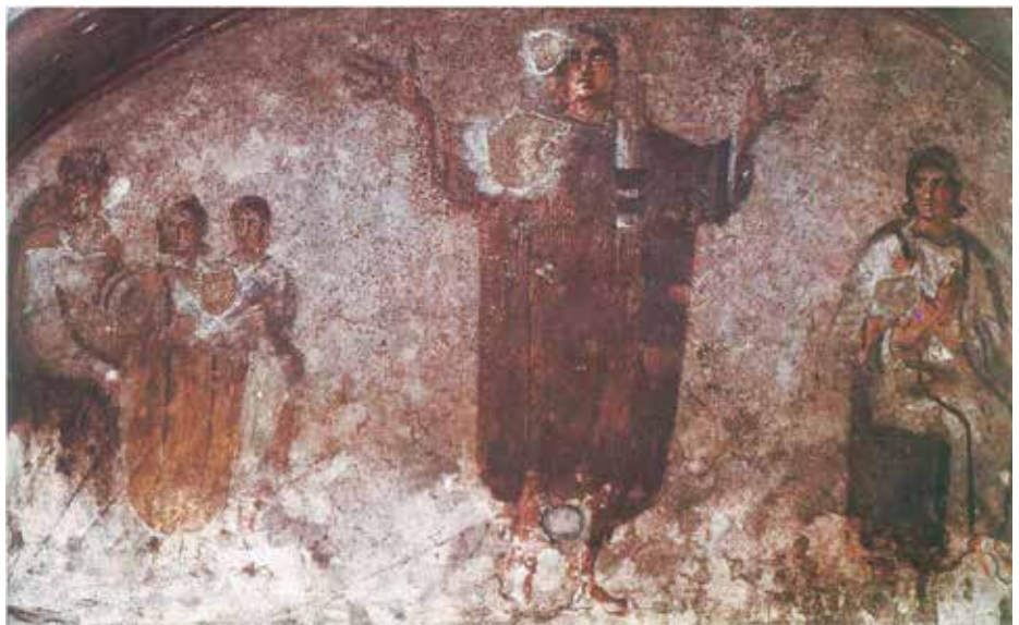
Catacumbes de Priscil·la a Roma

El que ve a continuació no és un comentari respecte al desenvolupament del diaconat en la història a través dels testimonis escrits, això ho podem trobar en articles, llibres, xerrades o cursets als quals podem assistir. El que trobarem, com una mena d’alerta, seran els errors en els quals no podem caure en fer l’anàlisi de la situació, i els problemes metodològics amb què teòlegs i teòlogues es troben i evitar els comentaris, a vegades massa simplistes, que puguem sentir. És a dir, el que es pretén és exercir i mantenir una actitud crítica fonamentada..., i continuar treballant! 2