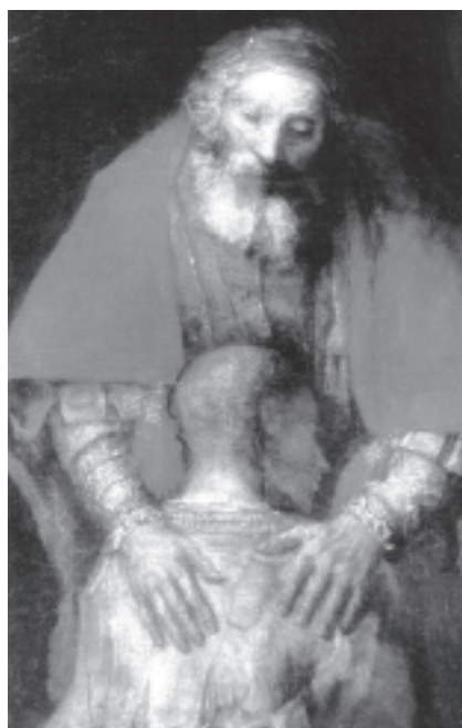
"El retorn del fill pròdig" Rembrandt (fragment)

Jo crec que avui Jesús ens demana que siguem justos, pacíficadors, misericordiosos; que escoltem què ens diu el cor, i que preguem, això sí! pels nostres enemics. Ens demana que no siguem violents amb ells. Però sobretot que seguim l'impuls del bon Esperit de Déu. La nostra misericòrdia, en ple segle XXI, no ens permet dir a una dona que pateix violència domèstica: Si et pega en una galta, para-li també l'altra . Ens porta a exigir un salari just per a tothom i que siguin retornats tots els productes robats, sobretot la dignitat,