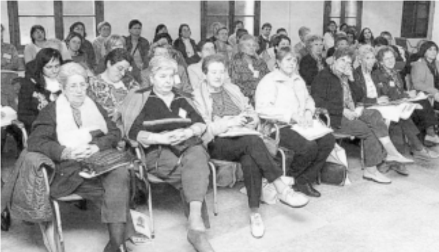
Alguns assistents a la XIV Trobada de Dones i Teologia