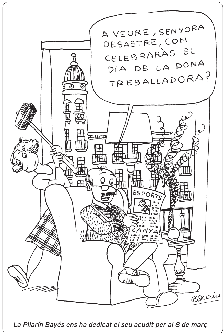
La Pilarín Bayés ens ha dedicat el seu acudit per al 8 de març