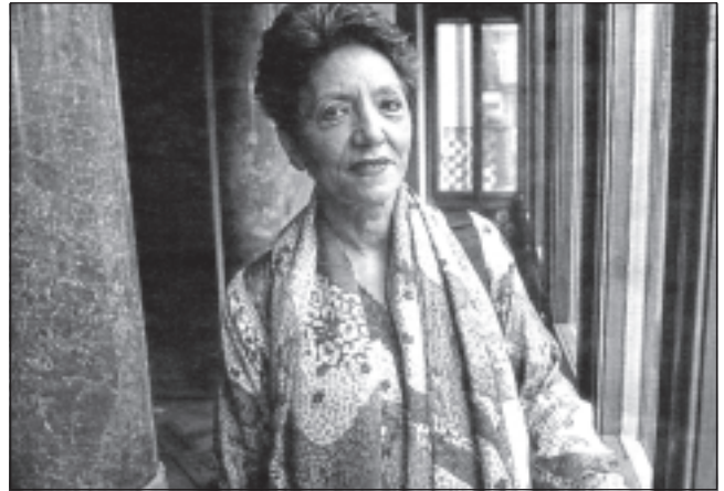
Attiya Inayatullah, exministra i diputada al Parlament pakistanès

problema principal és l'actitud tribal i patriarcal que hi ha.