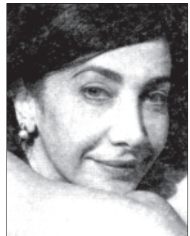
La poetessa síria Maram al Masri