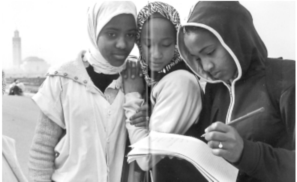
Dones marroquines. Fotografia extreta de la pàgina 28 del llibre "La dona i Déu".

vida quotidiana i familiar: la pròpia identitat, la família, l'escola dels infants, les compres, la visita al CAP o a l'hospital, el cos humà, la salut; en aquest àmbit, la nostra