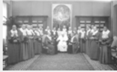
Tribunal de la Rota

"Som divorciats, creients i amb ganes de participar en la comunió de l'Església i dels cristians,