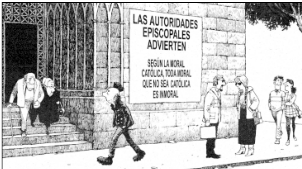
La Vanguardia 26/10/05

La Jerarquia no s'ha adonat encara que s'ha quedat obsoleta. No té respostes convincents da-