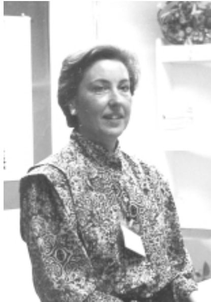
Recordo com al principi...

pertanyent a l'Església. L'Església aquesta gran desconeguda per a molta gent que la identifica amb els esgarips que sent de la jerarquia que el Vaticà ens ha donat. Hi ha una església, -nosaltres som església! evidentment-, tan i tan diferent