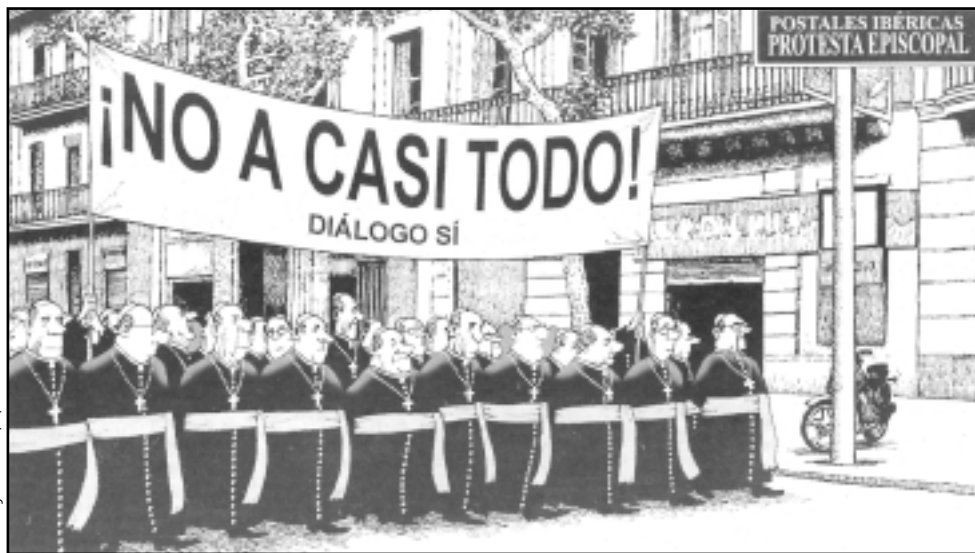
La Vanguardia 25/11/04

"...haver escollit com a residència barcelonina una torre a la part alta de la ciutat; l'habilitació i el manteniment de la qual carreguen a la diòcesi un